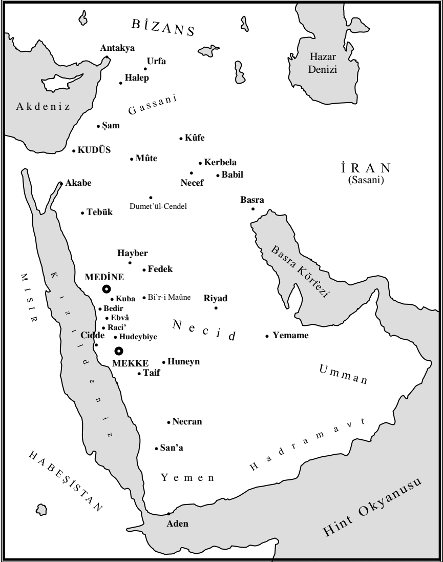
H. Muhammed (s.a.v.) zamanında Arabistan